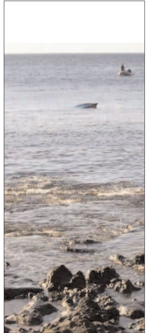
Patera hundida frente a la costa española

Plenario de la Asamblea de Attac Madrid (21-junio-2008)