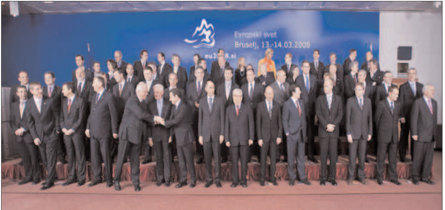
Reunión de líderes europeos para tratar la propuesta de Unión por el Mediterráneo

El proyecto de “Unión por el Mediterráneo”, cuyo lanzamiento oficial ha tenido lugar en París el 13 de julio de 2008, no podrá restablecer la paz en la región del Medio Oriente, ni crear una “zona de prosperidad compartida” para los pueblos de la región, ni garantizar una igualdad de derechos políticos, económicos, sociales y culturales entre los 37 países miembros de esta futura Unión.