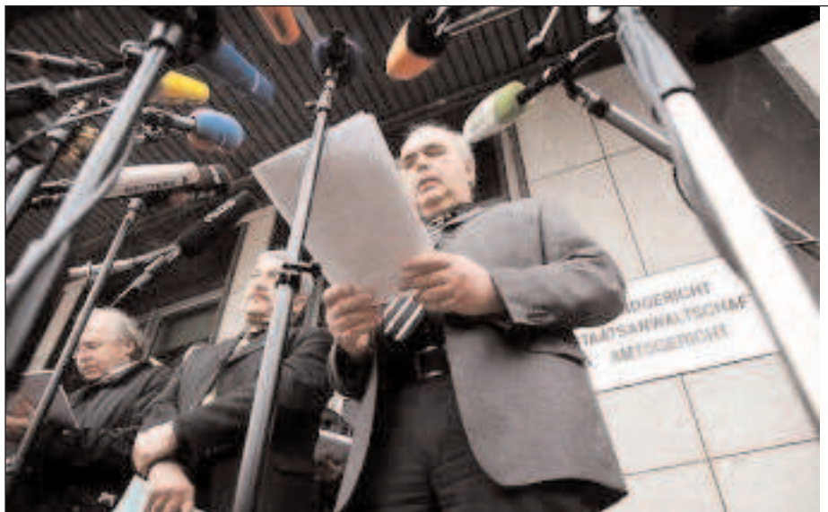
El fiscal alemán que destapó el escándalo de Liechtenstein